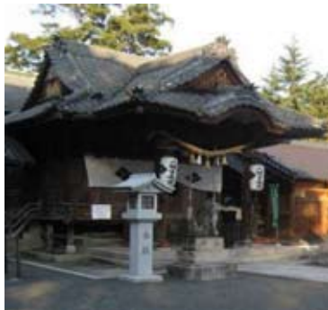
＜八幡古表神社（吉富町）＞

訪れる人々をもてなし迎え入れる、穏やかでやさしい景観を形成している京築地域の景観を象徴的に表現する言葉として“豊姫の国”を今回のテーマ協定で設定しました。