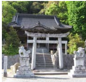
＜龍日賣神社（行橋市）＞